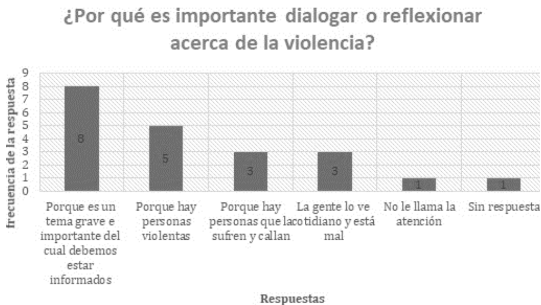
Gráfica 2. La importancia de dialogar y reflexionar sobre la violencia

De 17 participantes, 14 afirmaron que cambió su perspectiva en torno al tema. La tabla 2 contiene sus respuestas.