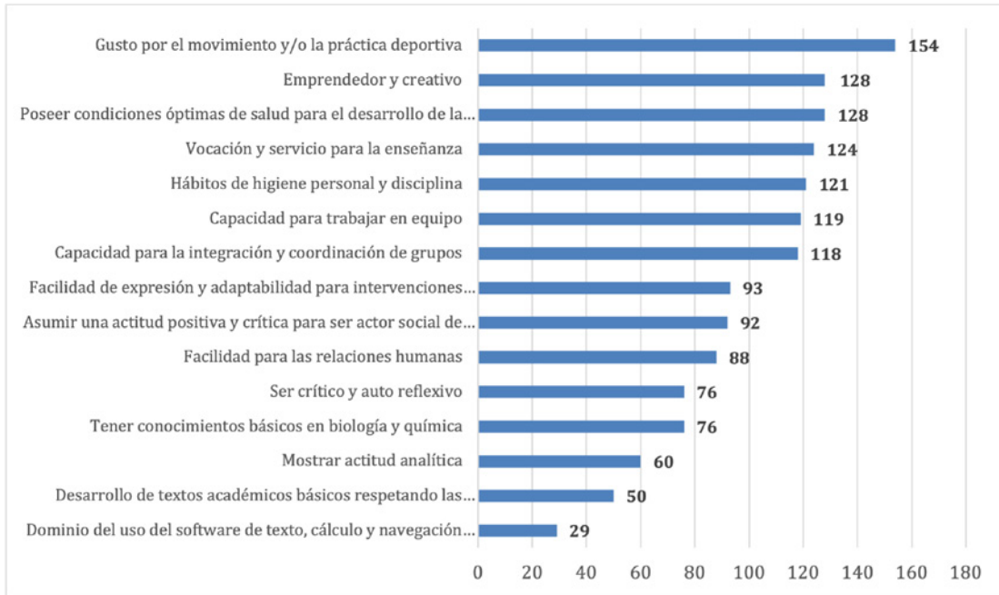
Gráfica 1. Perfil ideal de un buen educador físico