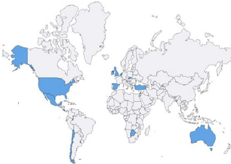
Figura 2. Distribución geográfica de los estudios localizados.

De acuerdo con la figura 2, cinco estudios fueron realizados en países de América, doce, en Europa, y uno en África y otro en Oceanía. La tabla 2 contiene el número de artículos agrupados por continentes y países.